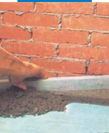
Aplicarea sapei pe baza de ciment aditivată cu Planicrete

fie solide, compacte și curate. De pe suport se vor îndepărta particulele neaderente, praful, laptele de ciment, urmele de uleiuri, decofrol și vopsea, etc., prin sablare cu nisip, periere sau prin sablare cu apă de înaltă presiune. Stratul suport se va uda cu apă până la saturație, după care se așteaptă zăvântarea suprafeței, în caz contrar pelicula de apă se comportă ca antiadeziv.