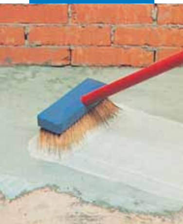
Aplicarea amorsei de aderență pe baza de ciment aditivată cu Planicrete