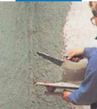
Sprit adeziv aditivat cu Planicrete