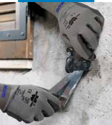
Fixarea balamalelor și elementelor metalice în zidărie folosind Lampocem