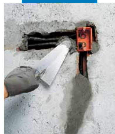
Fixarea dozelor și cimentarea traseelor pentru cablurile de instalații electrice folosind Lampocem