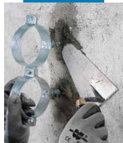
Fixarea colierelor metalice pentru susținerea țevilor folosind Lampocem