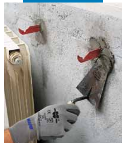
Ancorarea elementelor metalice pentru calorifere folosind Lampocem